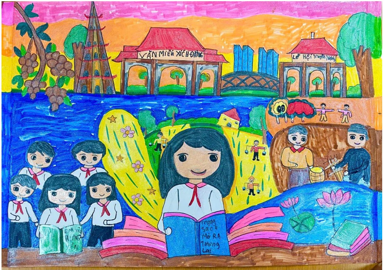
Tác phẩm “Hưng Yên – trang sách mở ra” của em Chu Ngọc Hiền, lớp 5E