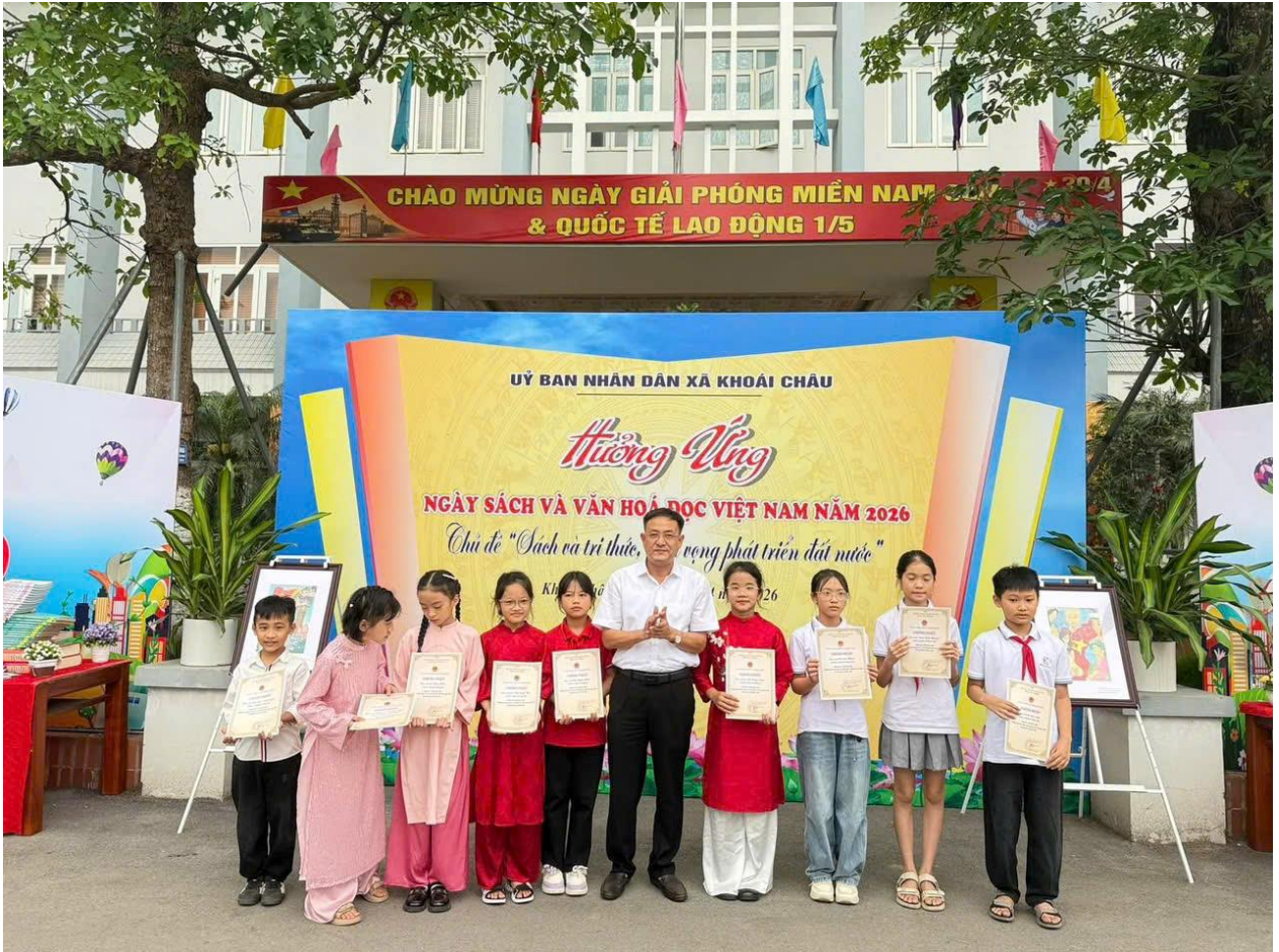
Một số hình ảnh